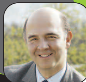
Pierre Moscovici, président de la Communauté d'agglomération du Pays de Montbéliard.